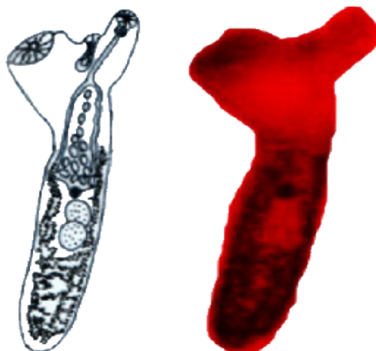
شکل شماره ۱: تصویر و ترسیم انگل Opercoelus acutus شناسایی شده در این مطالعه

شکمی، قطر فارنکس حلق ۸۰ در ۷۵ میکرون، منفذ جنسی همسطح فارنکس حلق بوده است. اندازه قطر تخم ۱۳۰ در ۱۲۰ میکرون، دارای دریچه و فاقد نوزاد بود. (شکل شماره ۱)