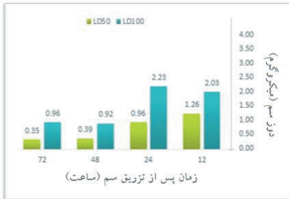
شکل ۲- مقایسه نتایج تست‌های LD50 و LD100 در ساعات مختلف پس از تزریق سم.

مطالعه حاضر نشان‌دهنده بروز مقاومت در لاروهای ساقه‌خوار نیشکر نسبت به تجویز زهر عقرب بصورت خوراکی می‌باشد. در راستای نتایج این تحقیق نیز در مطالعه‌ای آمده که تجویز خوراکی سم فاقد پیامدهای