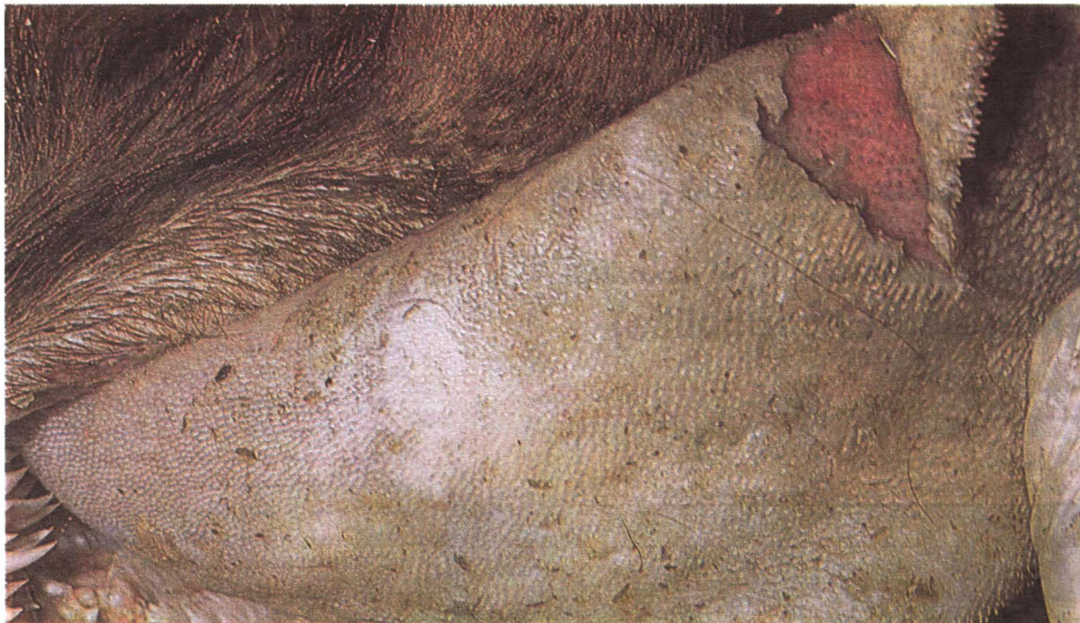
شکل ۲ اروزیون و زخم در مخاط زبان در بیماری تب برفکی