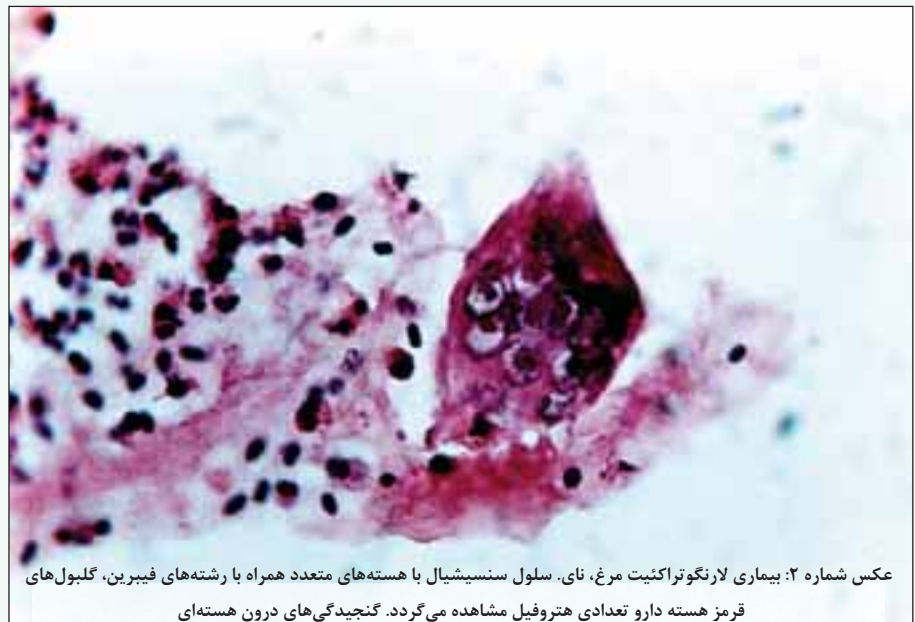
عکس شماره ۲: بیماری لارنگوتراکتیت مرغ، نای. سلول سنسیشیال با هسته‌های متعدد همراه با رشته‌های فیبرین، گلبولهای قرمز هسته دارو تعدادی هتروفیل مشاهده می‌گردد. گنجیدگی‌های درون هسته‌ای

های آن کانونهای خون ریزی به چشم می‌خورد. لامیناپروپریا، علاوه بر ادم و پرخونی شدید، نفوذ تعداد زیادی از سلولهای آماسی تک هسته‌ای با غالبیت لنفوسیت و پلاسماسل و مقادیر کمی از ماکروفاژ و هتروفیل را نشان می‌داد. به‌علت نکروز و کنده شدن اپیتلیوم، قسمت اعظم مخاط نای