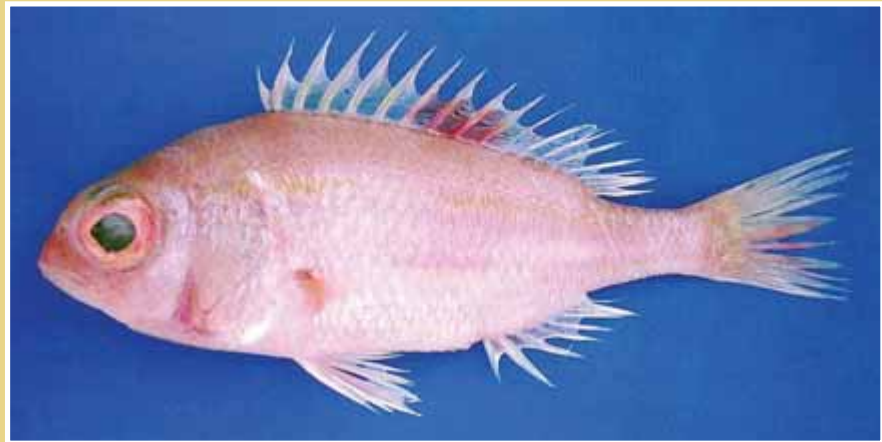
شکل ۲: گونه Parasclopsis baranesi صید شده در دریای عمان با طول استاندارد ۹۷/۱ میلی‌متر، کد ۰۰۳۶ OFRC (تابستان ۱۳۸۲)

خلیج عقبه و محدوده عمقی محل صید ۱۶۰ الی ۵۰۰ متر بیان شده است. همچنین حداکثر طول استاندارد آن ۱۱۲/۰ میلی‌متر گزارش شده است (۱۱).