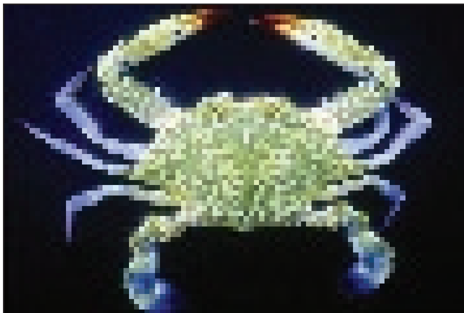
شکل ۱. سطح پشتی خرچنگ شناگر آبی Portunus pelagicus