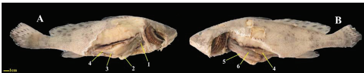
شکل ۱- کالبدشناسی ساختارهای حفره سلومی در میسماهی معمولی، A: نمای سمت چپ، B: نمای سمت راست.