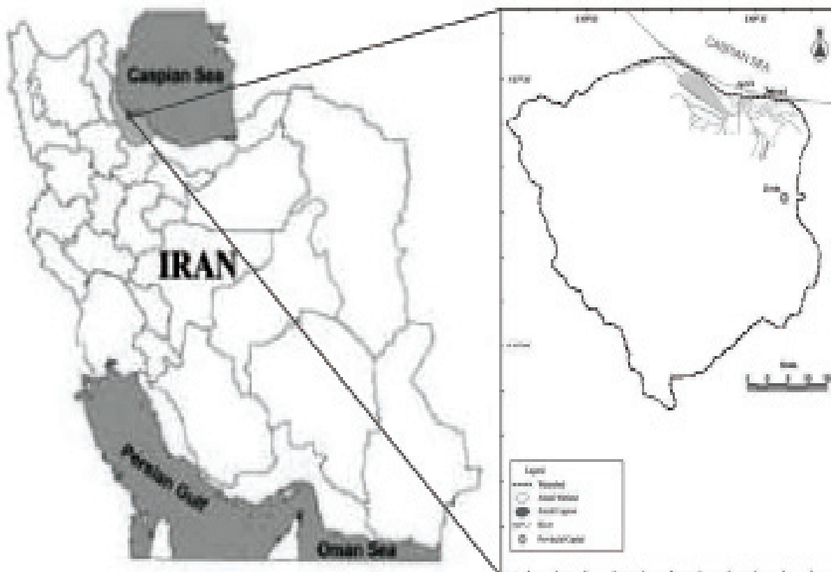
شکل ۱- موقعیت جغرافیایی منطقه مورد مطالعه

در این تحقیق نرمال بودن داده‌های بدست آمده با آزمون کلموگرف-اسمیرنوف مورد بررسی قرار گرفت. سپس برای تجزیه و تحلیل داده‌ها از آنالیز تجزیه واریانس ۲ یک طرفه استفاده شد. برای تعیین اختلاف معنی‌دار بین میانگین‌های غلظت جیوه در تیمارهای مختلف از آزمون دانکن با سطح